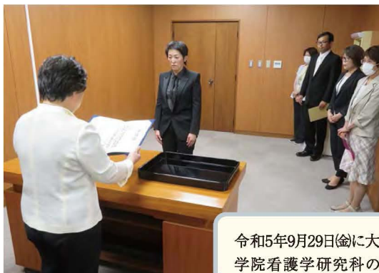
大学院学位記授与式(前期)