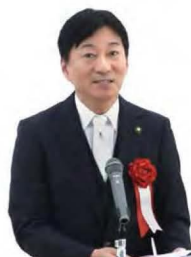
米澤光治 敦賀市長