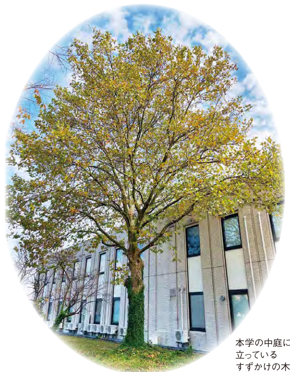
本学の中庭に立っているすずかけの木

この10年でより大きく成長したすずかけのように、これからも地域の中で学び、地域と共に学生を育て、成長し続ける大学でありたいと思います。