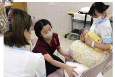
助産学専攻科と看護学部の合同演習