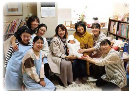
たきざわ助産院産前産後の家での助産学実習